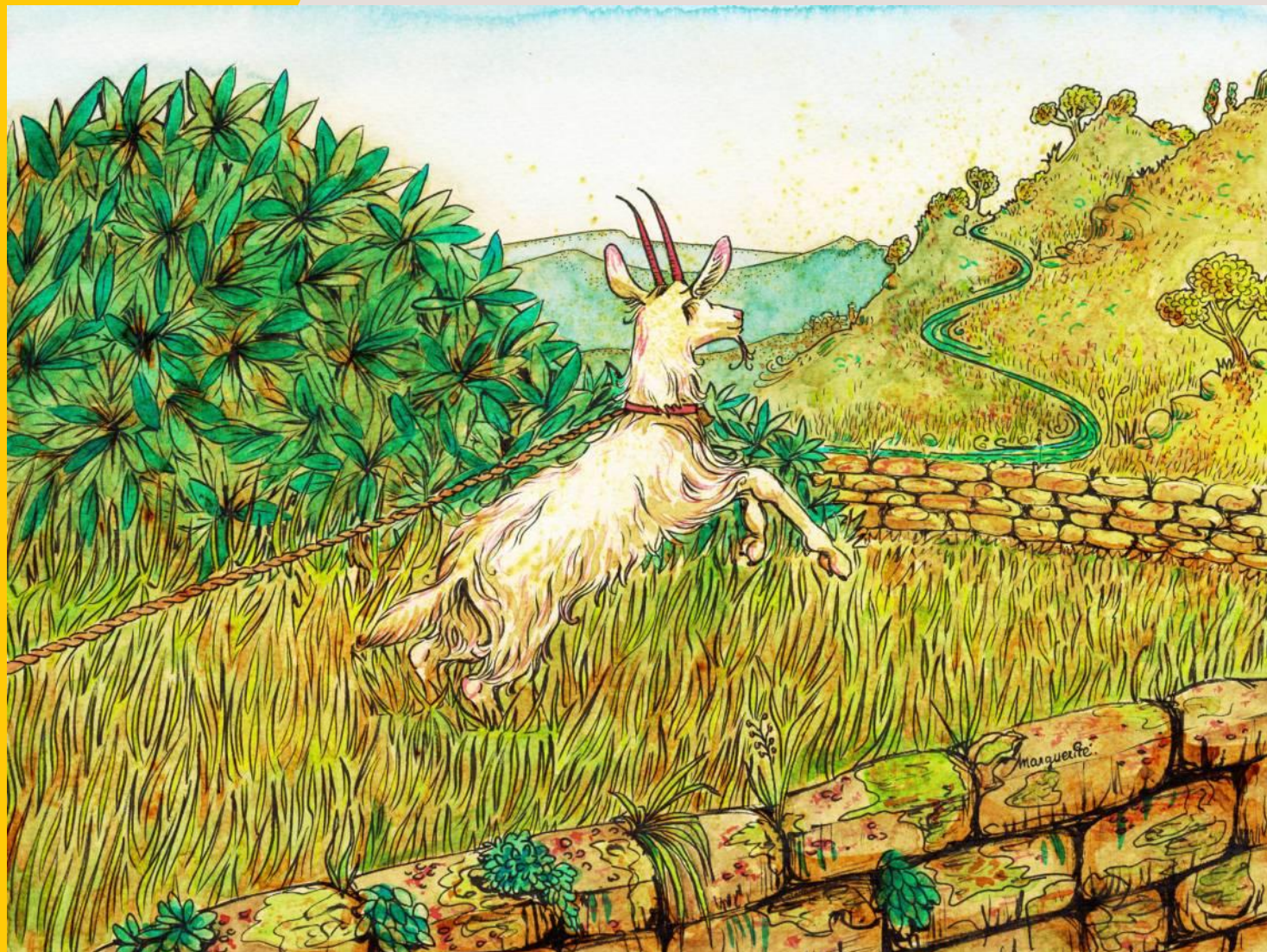
ILLUSTRATION DE MARGUERITE LE BOUTEILLER

À PRÉSENT, LISONS LA PREMIÈRE PARTIE DU CONTE.