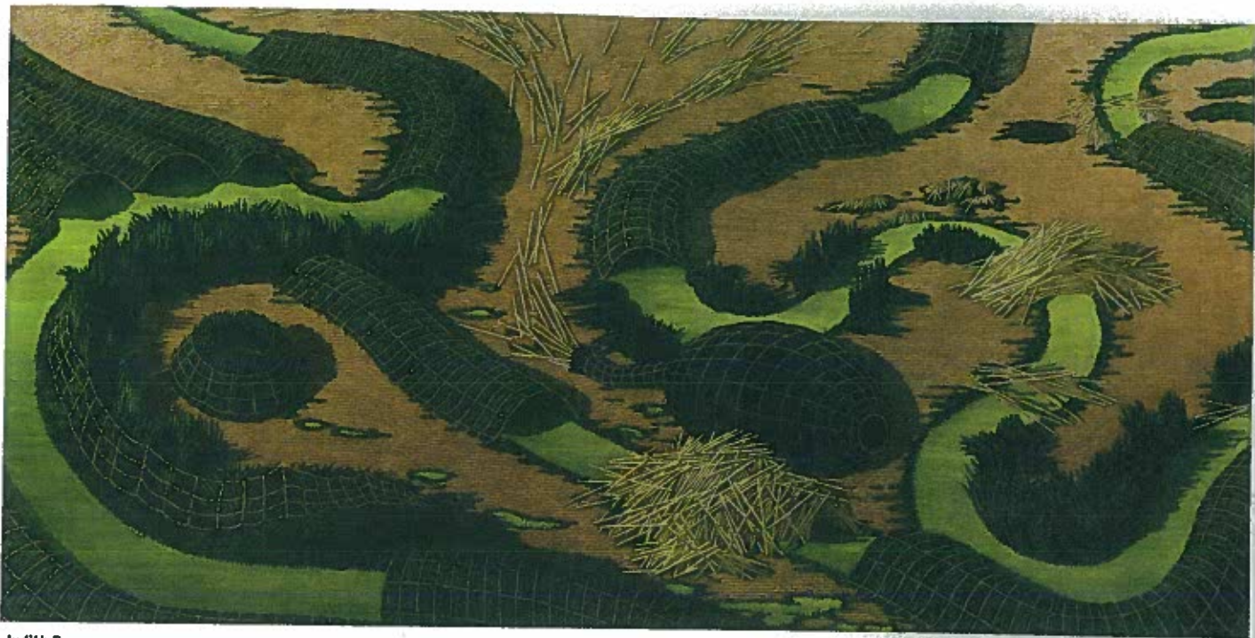
Judith Berry Friday Afternoon Postponed, 2006 Huile sur toile 157 x 310 cm

région sélectionnées par un jury local. Certaines de ces œuvres pourront être acquises pour enrichir la Collection. « La présentation publique de ces œuvres donnera la chance à leur créateur de se faire connaître et – qui sait? – de propulser leur carrière », précise Louis Pelletier, conservateur de la Collection.